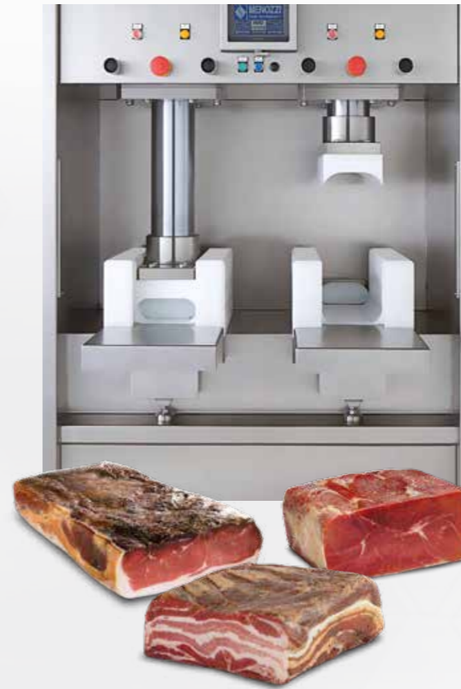
Applicazione con doppio stampo per mattonelle Aplicación con doble molde para jamon rectangular