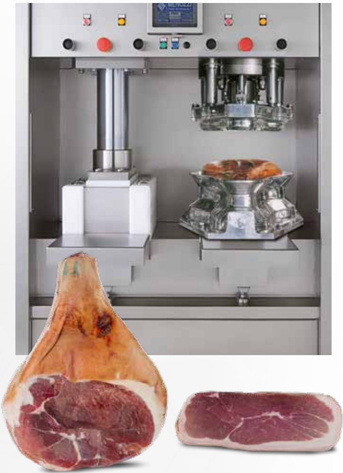
Applicazione con stampo tradizionale e stampo per mattonelle Application with traditional and rectangular shape molds

Macchina automatica per la pressatura di prosciutti crudi disossati, speck e prodotti simili per formati tipo tradizionale e mattonelle. L'azione di pressatura dei cilindri permette di compattare il prodotto nei tempi e modi prescelti da programma. Mediante il pannello di controllo touch screen è possibile impostare la pressione desiderata e il tempo di pressatura garantendo così una perfetta omogeneità del prodotto.